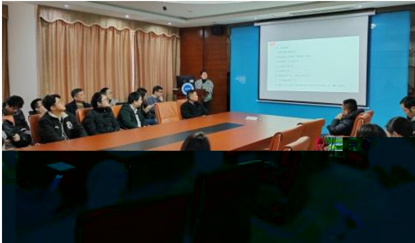
图 员工专业技能培训

，公 促 发 和 才 方 得 成 。 过 创 的 和 ， 不 动 公 的 持 成长， 工 供 的发 机会。 过 供多 化的 和发 ， “ 队 共 ” 等 活动 ( )， 帮 工 ( 技 和管 ； 并 的 和 规划， 工的 合 和 ， 包 导 发 计划、技 技 及 部 等， 地促 工的 方 发 。