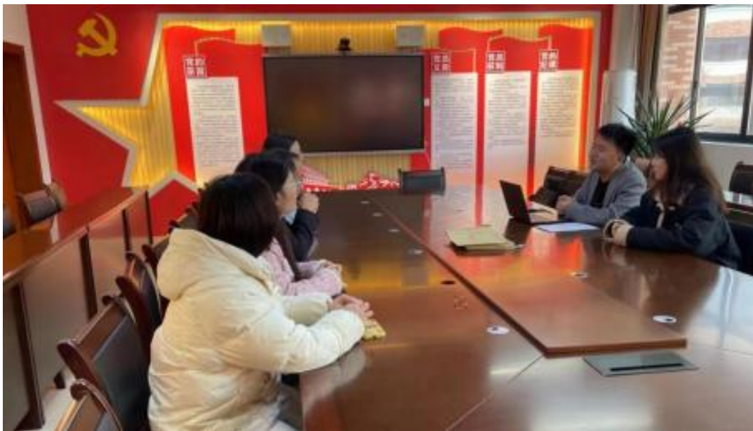
图 校企开展学术研讨项目交流会议

公 高度 队 的 ，充分 到 和 的关 ，对 高 和 关 的 。此公 供 ，包 更 、 方法 及 导 发 程，并 持 丰富 的 家 过 、 会 和 际案 ， 队 分 的 和 。 常 地 活动， 包 参加 会 、 等 ， 促 研 的 分 ， ， 并 的 队 ( )。