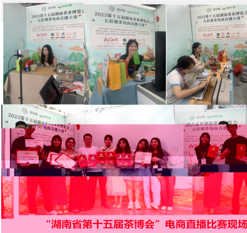
“湖南省第十五届茶博会” 电商直播比赛现场